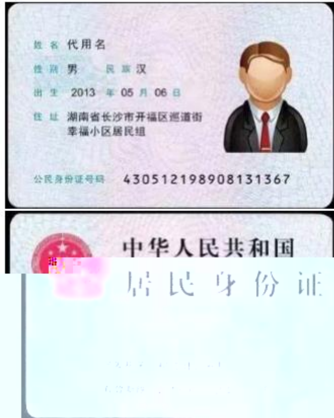
(身份证正反面示例)