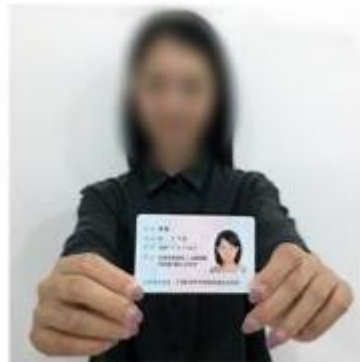
(手持身份证照片示例)